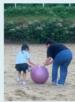
ゆうゆうミニ運動会