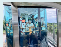
稲佐山スロープカー