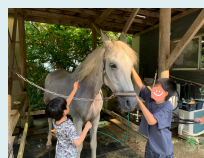
馬さんいつもありがとう