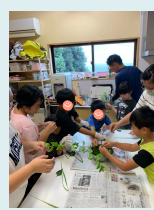
ハーブティー作り